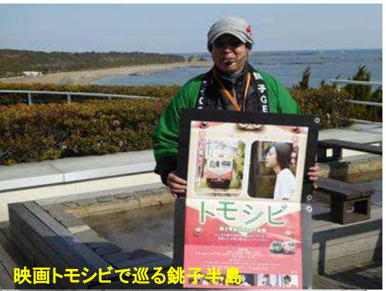
映画トモシビで巡る銚子半島

山監督とのインタビュー形式で映画の撮影秘話や、銚子のエキストラ参加者とのふれあいなどを語って頂きました。参加者…30名。DVD販売枚数…8枚 強風のため、急遽デハ801にて会場設